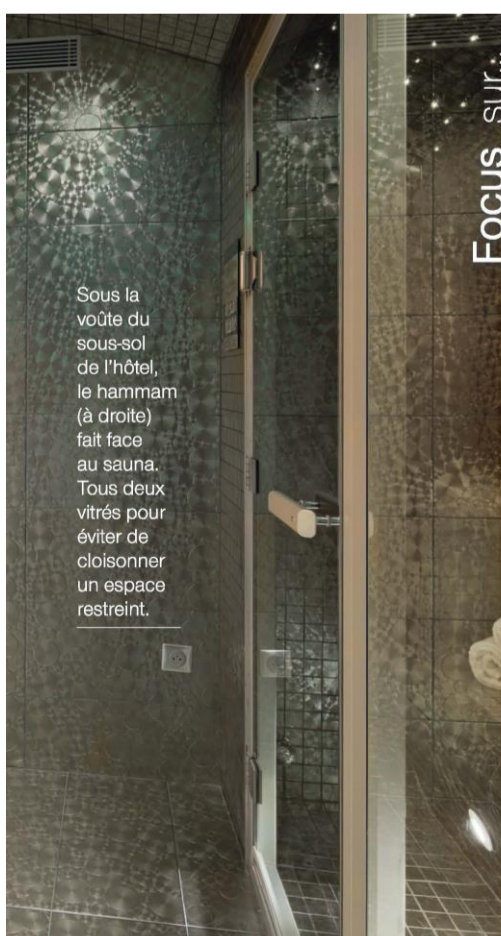
70 CÔTÉ PISCINE

Sous la voûte du sous-sol de l'hôtel, le hammam (à droite) fait face au sauna. Tous deux vitrés pour éviter de cloisonner un espace restreint.