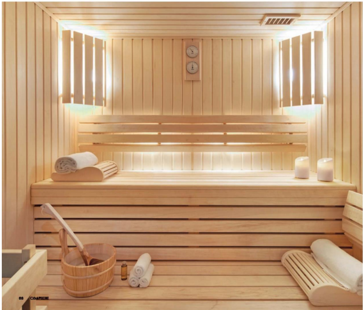
68 CÔTÉ PISCINE

Texte : Samantha Pagès • Photos : Guillaume Dupuy